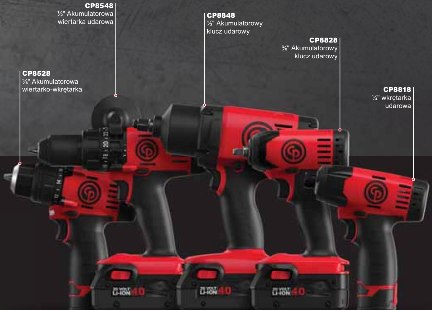
CP8548 1/2" Akumulatorowa wiertarka udarowa