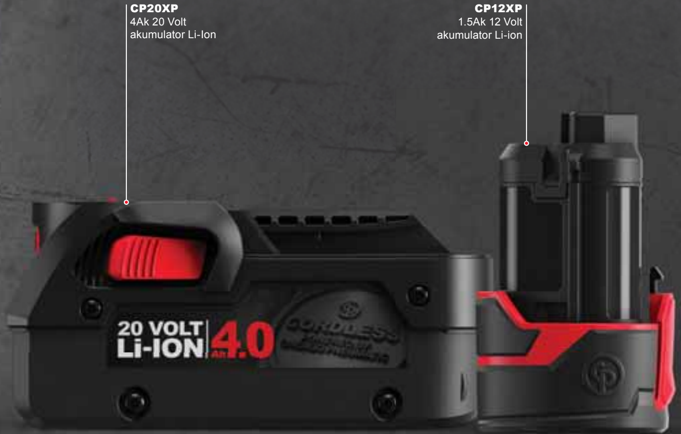
CP20XP 4Ak 20 Volt akumulator Li-Ion